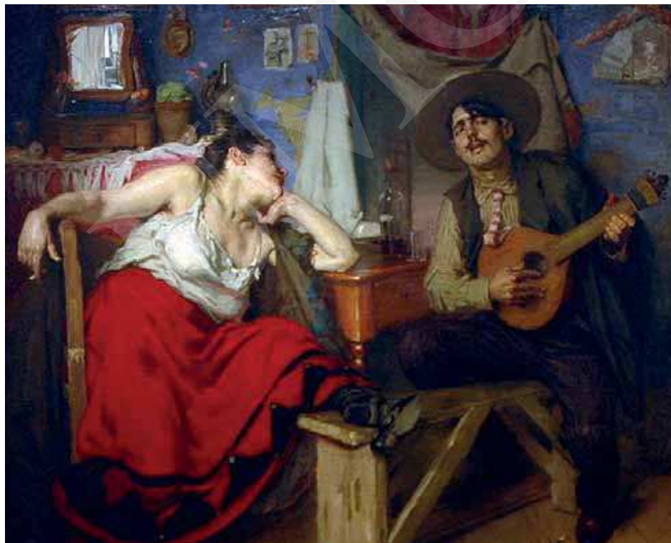
Ilustracja 1. Jose Malhoa, Fado , 1910, olej na płótnie, 150cm×183cm, Museu da Cidade, Lizbona; cyt. [za:] Vieira Nery, op. cit. , s. 87.

Warto w tym miejscu odnotować reakcje sztuk pięknych. Wokalno-instrumentalna interpretacja fado stała się na początku XX wieku natchnieniem dla portugalskiego malarza José Malhoa, który jedną ze swoich prac opatrzył tytułem Fado .