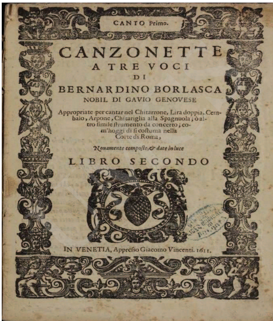
Ilustracja 4. Bernardino Borlasca, Canzonette , I-Bc, sygn. X. 140.