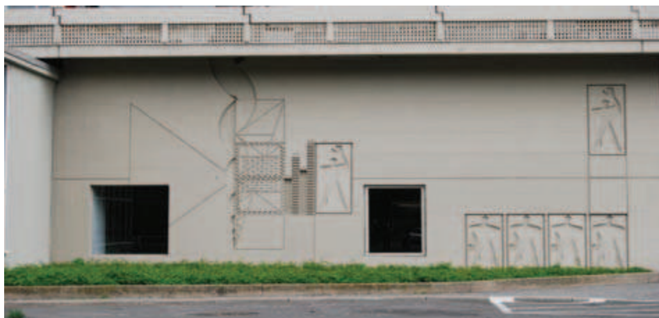
Ilustracja 12. Modulor na elewacji Jednostki Berlińskiej, fot. A. Pilip (2010).