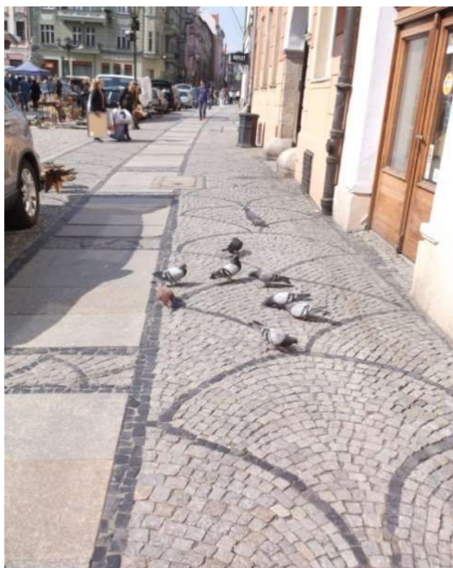
Fot. 8. Gołębie

Na kolejnym znaczku widzimy szczygła. Ptaki te wraz z ludźmi rozprze-strzeniły się na Euroazję, Afrykę, Australię i Amerykę Południową. Ten przybył z Borsbeek w południowo-wschodniej Antwerpii, gdzie pojawił się na tym znaczku wyemitowanym 11 lutego 1985 r. Nie jest jedynym ptakiem na naszym Rynku. Niedaleko spacerują po bruku mniej kolorowe ale żywe gołębie, zamieszkujące jak szczygły rozległe i odległe od siebie regiony świata. Rynek jest zatem miejscem spotkania także i różnych ptaków.