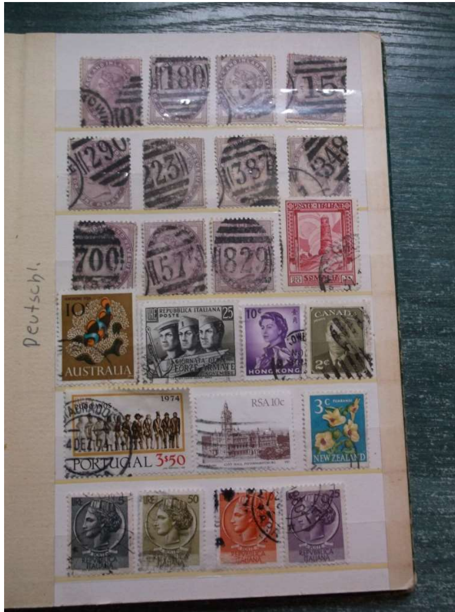
Fot. 3. Jedna ze stron

z różnych krajów świata. Belgia sąsiaduje z Indiami, Argentyna leży obok Szwajcarii, gdzie indziej Włochy, Chile oraz Szwecja, Turcja i Kanada. Ta specyficzna topografia czyni z albumu niepowtarzalny przedmiot i miejsce swoiste. Staje się on też szczególnym odwzorowaniem świata.