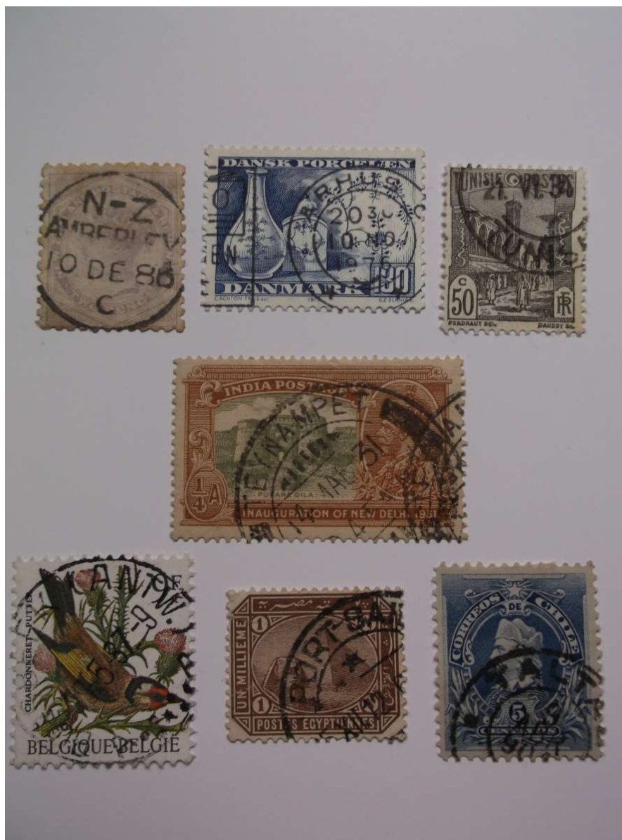
Fot. 4. Znaczki

plowania. W jakiej kolejności? Od najstarszego do najnowszego, a może od najmniejszego do największego? Od tego, który przebył najdłuższą drogę? Niech będzie kolejność z fotografii. To małe skrawki papieru. Największy w środku ma rozmiar 2,5 x 4 cm. Ten poniżej to 2 x 2,5 cm.