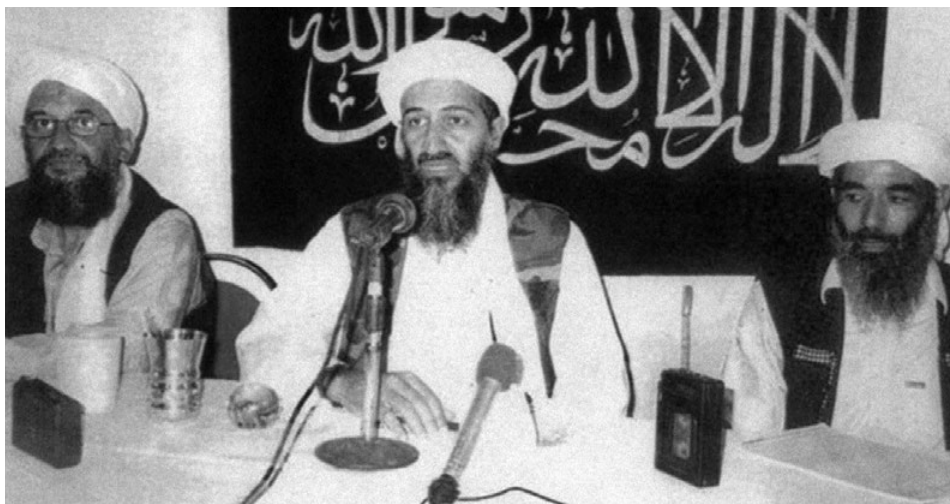
Rys. 1. Goście audycji propagującej przez internet terroryzm

tylko o potomków muzułmańskich imigrantów ulegających radykalizacji religijnej i ideologicznej, ale również o młodych ludzi zafascynowanych nową religią i nową ideologią. Minister bezpieczeństwa USA, Michael Chertoff, składając wyjaśnienia przed senacką Komisją Bezpieczeństwa Wewnętrznego i Spraw Rządowych, powiedział, że internet jest obecnie głównym medium, przez które Al-Kaida zdobywa zwolenników w USA.