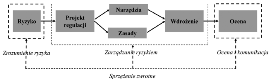
Rys. 1. Schemat postępowania legislacyjnego przy wykorzystaniu koncepcji Risk-based Regulation

Procedowanie w ramach koncepcji RbR odzwierciedla rys. 1. Zgodnie z nim proces wykorzystania koncepcji RbR sprowadza się do realizacji trzech etapów (faz). Są to: zrozumienie ryzyka, właściwego zarządzania ryzykiem i przeglądu wyników dostosowania się podmiotów regulowanych [Peterson, Fensling, 2011, s. 8]. W pierwszym etapie dokonuje się oceny ryzyka i hierarchizacji określonych rodzajów ryzyka (przez system punktacji) w kontekście zastosowania odpowiednich zasobów. W drugim etapie przeprowadza się projektowanie i wdrożenie wyboru narzędzi zarządzania ryzykiem, w szczególności unikania ryzyka, redukcji ryzyka, wstrzymania się lub jego transferu. W trzecim etapie przeprowadza się ocenę efektów wdrożenia regulacji, czy są symptomy i fakty, które potwierdzają, że cele regulacji zostaną osiągnięte i na ile przyjęte narzędzia zarządzania ryzykiem są skuteczne. Ta faza stwarza możliwości doskonalenia poprzednich etapów. Jest to etap sprzężenia zwrotnego, weryfikuje się w nim przyjęte rodzaje ryzyka i dostosowuje kolejne etapy do wyników takiej analizy. Należy podkreślić, że rys. 1 pokazuje, że tylko w pierwszym etapie dokonuje się oceny ryzyka konkretnego projektu legislacyjnego.