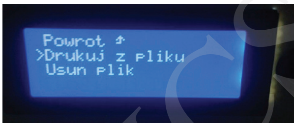
Fot. 4. Wybór akcji pliku.

Zalecana wysokość temperatury to 220°C. Gdy już upewnimy się, że wszystkie wyżej wymienione czynności zostały wykonane, z wyświetlanego menu za pomocą pokrętki wybieramy nazwę projektu i zatwierdzamy wciśnięciem pokrętki.