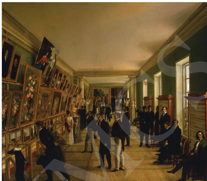
Ryc. 1. Format kieszonkowy – Wincenty Kasprzycki, Widok Wystawy Sztuk Pięknych w Warszawie 1828, 1828 r. , olej na płótnie 94,5 x 111 cm. Muzeum Narodowe w Warszawie.

W większości katalogi są oprawiane w tekturę, często ozdobną, tzw. marmurkową, albo w papier szary i jest to oprawa późniejsza, biblioteczna. Oprawa marmurkowa tekturowa występuje m.in. w Katalogu dzieł sztuk pięknych oraz Katalogu wystawy retrospektywnej nieżyjących malarzy polskich 33 . Były one oprawiane również w oprawy papierowe, czasami barwione na różne kolory. Prezentowane oprawy tekturowe i papierowe miały ograniczone zdobnictwo. Przede wszystkim walory estetyczne oprawy katalogu podnosił kolor tektury lub papieru – barwiono je na brązowo, zielono, niebiesko lub czerwono. Katalogi, jako wydania tzw. proste, obejmujące jedynie tekstową część informacyjną, oprawiano broszurowo 34 .