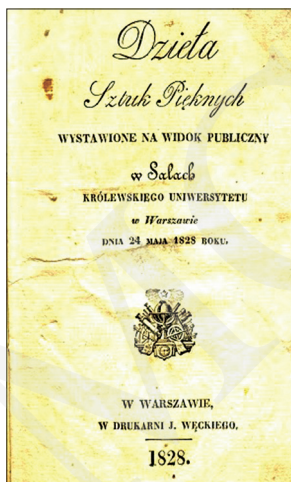
Ryc. 2. Karta tytułowa – Dzieła sztuk pięknych wystawione na widok publiczny w salach królewskiego uniwersytetu w Warszawie dnia 24 maja 1828 , Druk. J. Węckiego, Warszawa 1828.

osi pionowej w ścisłych granicach geometrycznej figury smukłego prostokąta lub trójkąta 48 . W katalogach wystaw artystycznych obserwujemy nawiązywanie do zamkniętej kompozycji karty tytułowej, podobnie jak w oświeceniowej, klasycznej typografii 49 .