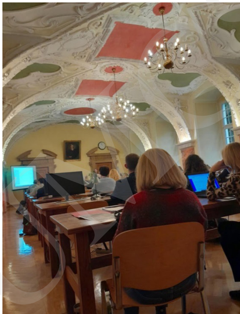
Fot. 9. Prezentacja jednego z wystąpień.

króla, „wziąć pod rękę Marsa, by wspomagać go w lepszych czasach”. Tło polityczne stanowił powrót Króla Zygmunta III Wazy z podróży do Szwecji, a wątki poruszane w poemacie są odwołaniem do złych nastrojów i bezprawia, jakie opanowały Starą Warszawę i Nowe Miasto.