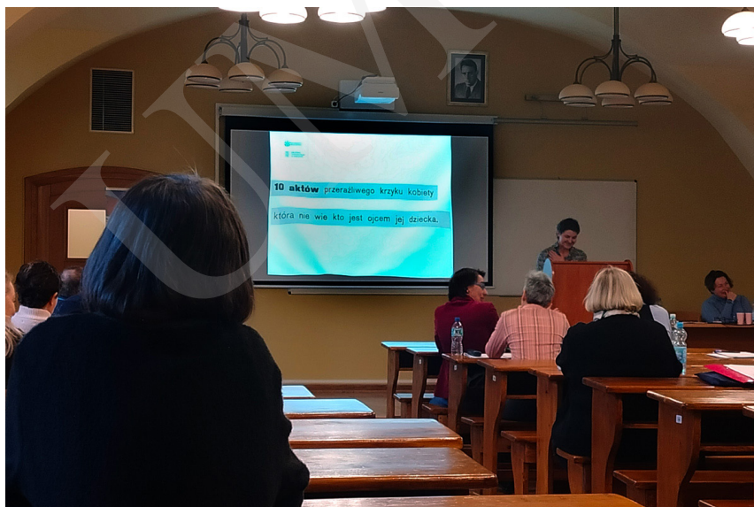
Fot. 4. Prezentacja jednego z wystąpień.