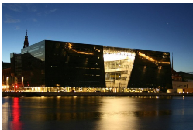
Fot. 7. Biblioteka Królewska w Kopenhadze.

W XXI w. nowo wybudowane budynki biblioteczne stały się przykładami nowoczesności, łącząc tradycyjne funkcje z innowacyjnymi rozwiązaniami technologicznymi i architektonicznymi. Jedną z najnowocześniejszych bibliotek w Europie jest Biblioteka Królewska w Kopenhadze powszechnie nazywana „Czarny Diament” ze względu na charakterystyczną elewację z czarnego granitu. Budynek znajduje się