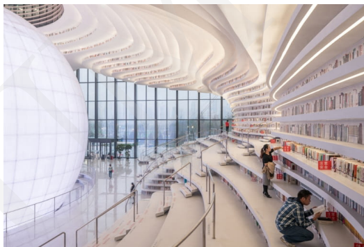
Fot. 11. Biblioteka Binhai w Tianjin, fot. Ossip van Duivenbode. Źródło: https://www.bryla.pl/bryla/7,85298,22639247,futurystyczna-biblioteka-w-chinach-od-mvrdrv.html .

Przykłady te pokazują, jak bardzo innowacyjne potrafią być budynki biblioteczne łączące funkcjonalną architekturę, estetykę i zaawansowaną technologię. Widoczne jest tworzenie miejsc przyjaznych czytelnikowi, sprzyjających nauce i integracji społecznej. Biblioteki tym samym odpowiadają na zmieniające się potrzeby społeczeństwa i rozwój technologiczny.