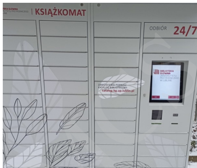
Fot. 13. Książkomat Biblioteki Uniwersytetu Przyrodniczego w Lublinie.