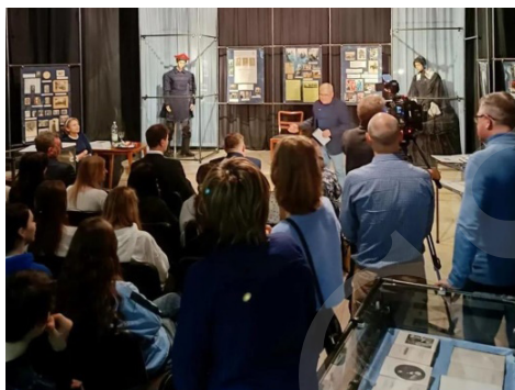
Fot. 3. Wernisaż wystawy „Szembekowie i Fredrowie w Dziejach Polski”.