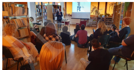
Fot. 4. Spotkania z mangą i anime.