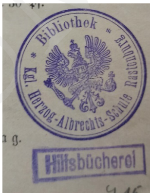
Ryc. 11. Pieczęć Biblioteki Gimnazjum w Rastenburgu.

Izba Przemysłowo-Handlowa w Lublinie powstała w marcu 1929 r. 38 W pracach nad jej założeniem brali udział polscy i żydowscy właściciele największych przedsiębiorstw handlowych, przedstawiciele kupiectwa lubelskiego i wołyńskiego, osoby reprezentujące banki i największe zakłady przemysłowe, a także znani działacze społeczni, radni miasta i politycy. Z jej inicjatywy została utworzona w 1931 r. Giełda Zbożowo-Towarowa w Lublinie 39 oraz jej filia w Równem na Wołyniu. Izba Przemysłowo-Handlowa w Lublinie posiadała bibliotekę 40 . Na mocy zarządzenia przewodniczącego Państwowej Komisji Planowania Gospodarczego w 1950 r. zakończyła działalność. Likwidacja jej spowodowała, że obszerny księgozbiór, liczący 5,5 tys. tomów, wraz z czasopismami, został przekazany do Zakładu Ekonomii Politycznej Katedry Ekonomii Wydziału Prawa i międzywydziałowego Instytutu Nauk Ekonomicznych UMCS. „Dzięki temu UMCS zawdzięcza Izbie posiadanie nieocenionych sprawozdań wojewody wołyńskiego. [...] Praktycznie każdy tom opatrzony był interesującym exlibrisem, przedstawiającym patrona kupców – Merkurego (w uskrzydłonym kapeluszu) oraz kołem zębatym – symbolem przemysłu” 41 .