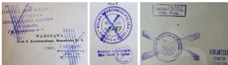
Ryc. 3. Przykłady anulacji pieczętek. Źródło: oprac. własne.

Odcisk tuszowy pieczętki można łatwo usunąć za pomocą odpowiednich odczynników chemicznych, w przeciwieństwie do odbitej farbą drukarską czy wykonanej przy użyciu suchego tłoku. Spotyka się też przypadki dewastacji pieczętek przez usunięcie fragmentu strony, na której się znajdowała, jej wycięcia czy zamazania ciemnym tuszem lub innym środkiem uniemożliwiającym odczytanie, a także nałożenie – odbicie nowej pieczętki na już istniejącą (ryc. 4).