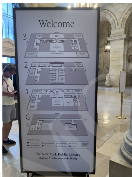
Fot. 2. Plan zwiedzania Biblioteki, fot. A. Strumińska.