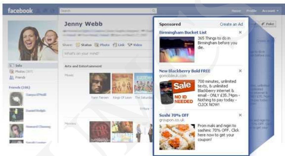
Ryc. 4. Facebook – reklama

lubi bądź obserwuje. Użytkownik ma przeświadczenie, że pokazuje znajomym, co lubi, a tak naprawdę dopuszcza do siebie kolejnych reklamodawców. Co gorsza, przeglądając strumień danych na Facebooku, użytkownik nie zauważa, że wśród informacji z profili znajomych znajdują się także ukryte reklamy 10 .