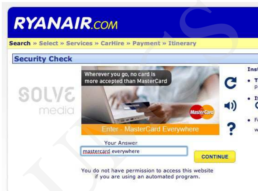
Ryc. 5. Ryanair – CAPTCHA

użytkownik i tak musi zapoznać się z reklamą, by przepisać tekst. Zapoznanie się z treścią reklamy jest zatem w tym przypadku nieuniknione 11 .