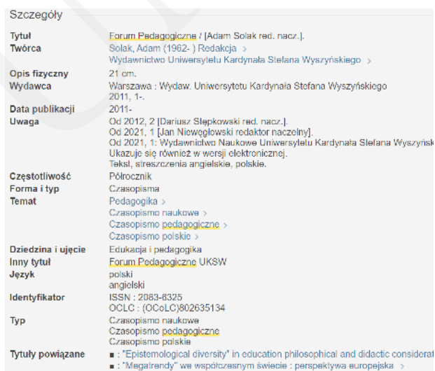
Ryc. 6. Zrzut ekranowy katalogu Biblioteki UMCS opartego na systemie PRIMO VE; Szczegóły pełnego widoku rekordu. Źródło: Katalog Biblioteki UMCS, [online], [dostęp: 26.01.2023].

Modyfikacjom uległ również widok pełnego opisu rekordu, prezentowany w katalogu jako Szczegóły (ryc. 6). Menu konfiguracyjne PRIMO pozwala administratorom zarządzać prezentowanymi polami z poziomu rekordów bibliograficznych, dając im możliwość samodzielnego wyboru tych danych. Przekłada się to na wzbogacanie opisów o stosowane np. pola lokalne (ang. Local Fields ) w danej bibliotece, ewentualnie wzbogacenie tymi danymi paska faset (filtrów). Konfiguracja funkcji Manage display and local fields umożliwia po pierwsze zdefiniowanie reguł normalizacji używanych do wyświetlania informacji dla gotowych pól rekordu w formatach źródłowych MARC21, UNIMARC, np. autor, wydanie, język publikacji, format i typ oraz inne, których można używać do wyświetlania jako inne elementy opisu wyświetlanego dokumentu. Z kolei definiowanie pola lokalnego (ang. Local Fields ) polega na mapowaniu dodatkowych informacji z rekordu źródłowego. Pola te mogą być następnie wykorzystywane do rozszerzania zapytań wyszukiwania, filtrowania (faset) wyników wyszukiwania za pomocą wyświetlania dodatkowych informacji w skróconych i pełnych widokach rekordów. Mapowanie dotyczy pól MARC21 rekordu bibliograficznego z zakresu pól 009, 09X, 490, 5XX, 69X i 9XX.